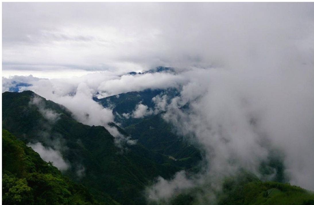
圖片介紹：104.5 集水區宇老雲海